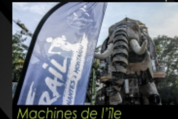
Machines de l'île