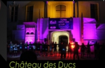
Château des Ducs

Des zones de départ depuis des lieux emblématiques